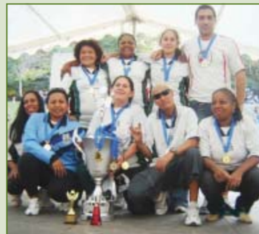
1º lugar - Equipe do Hospital de Clínicas