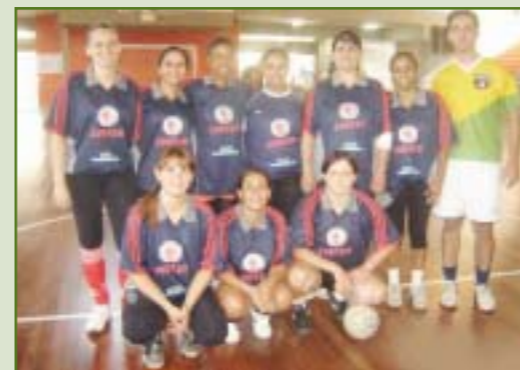
3º lugar - Equipe do Hospital Ulbra Luterano