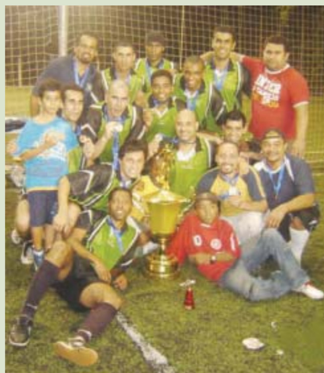
Campeã do Futset masculino Equipe da PUC