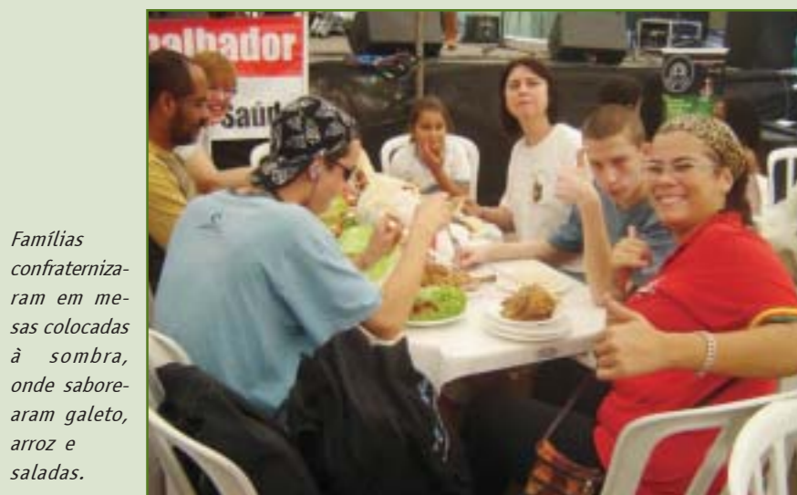
Famílias confraternizaram em mesas colocadas à sombra, onde saborearam galeto, arroz e saladas.