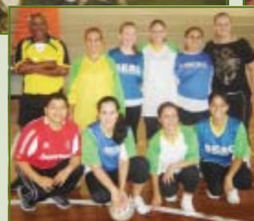
4º lugar - Equipe do Hospital Universitário da Ulbra