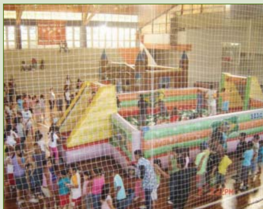
A festa foi alegre, com muita animação musical, torneios esportivos, brincadeiras para as crianças, sorteio de brindes, entre outras atrações. A diversão da criançada estava garantida, com vários brinquedos infláveis, como o tobogã.

Boa música, torneios esportivos e brincadeiras para as crianças proporcionaram uma festa muito agradável