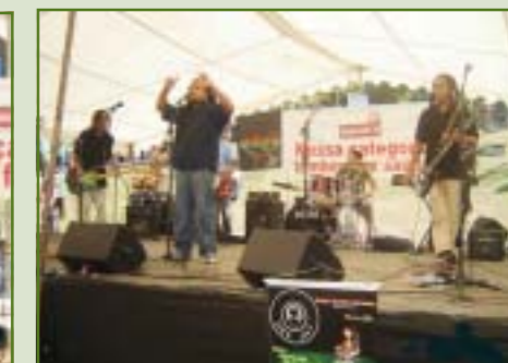
O reggae da competente banda Odoia apresentou um repertório dançante, com músicas famosas e outras de própria autoria.