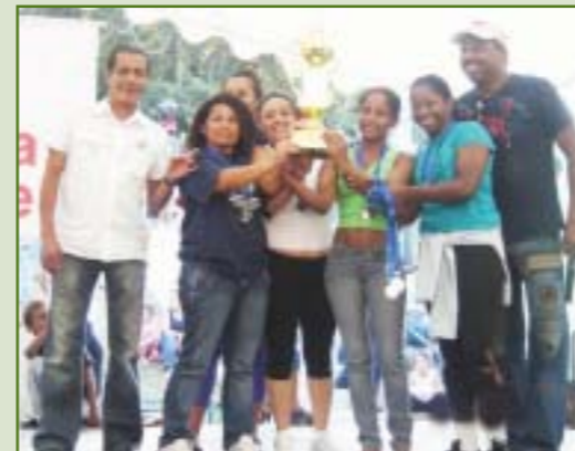
2º lugar - Equipe do Hospital da PUC