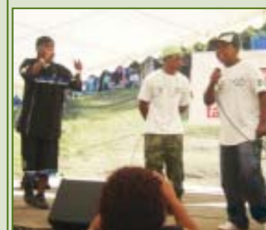
Jovens talentosos do hip-hop da banda Banca Forte da Paineira, do Morro da Cruz. Letras criativas e politizadas.